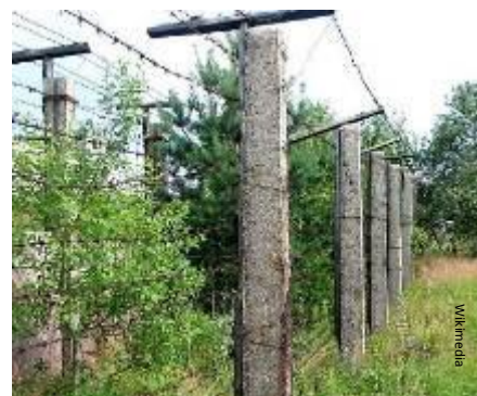
Restes du Rideau de fer en Ex-Tchécoslovaquie

Les pays qui ont ainsi gagné leur liberté ont réformé leurs lois et leurs économies et ont adhéré à l'UE. Actuellement, l'UE compte 28 pays membres (voir page 6).