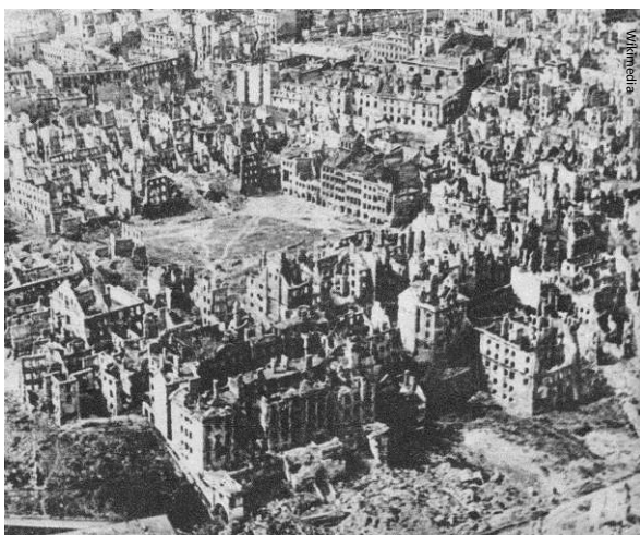
Presque tous les bâtiments de Varsovie ont été détruits à la fin de la Seconde Guerre mondiale.

Hélas, l'histoire de l'Europe n'est pas seulement celle des grandes réalisations dont nous pouvons être fiers. En effet, les nations européennes ont aussi mené des guerres terribles les unes contre les autres au fil de l'histoire. Le XX e siècle a vu s'étendre aux pays du monde entier deux grandes guerres qui ont commencé sur le continent.