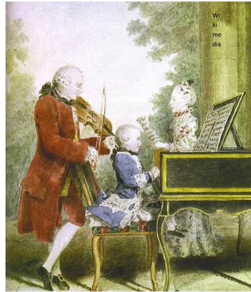
La famille Mozart (Wolfgang Amadeus avec son père Leopold et sa sœur Nannerl) a été plusieurs fois en tournée en Europe.

Au fil des siècles, de nouveaux styles de musique, d'architecture et de littérature ont inspiré les artistes de toute l'Europe. Les églises gothiques en Espagne et en Pologne, ou bien la musique classique de compositeurs italiens et autrichiens, ne sont que quelques exemples.