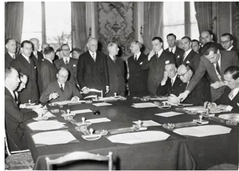
Le traité de la Communauté européenne du charbon et de l'acier a été signé à Paris en 1951.

Voilà pourquoi six pays européens (la Belgique, la France, l'Allemagne, l'Italie, le Luxembourg et les Pays-Bas) ont décidé de mettre en commun leurs industries du charbon et de l'acier. Ils ont ainsi créé la «Communauté européenne du charbon et de l'acier».