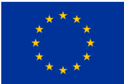
Le drapeau européen a été adopté par la Communauté économique européenne en 1985.

Ces six pays ont tellement bien collaboré entre eux qu'ils ont décidé d'aller plus loin en créant la Communauté économique européenne. «Économique» parce qu'il s'agissait d'argent, d'affaires, de travail et de commerce.